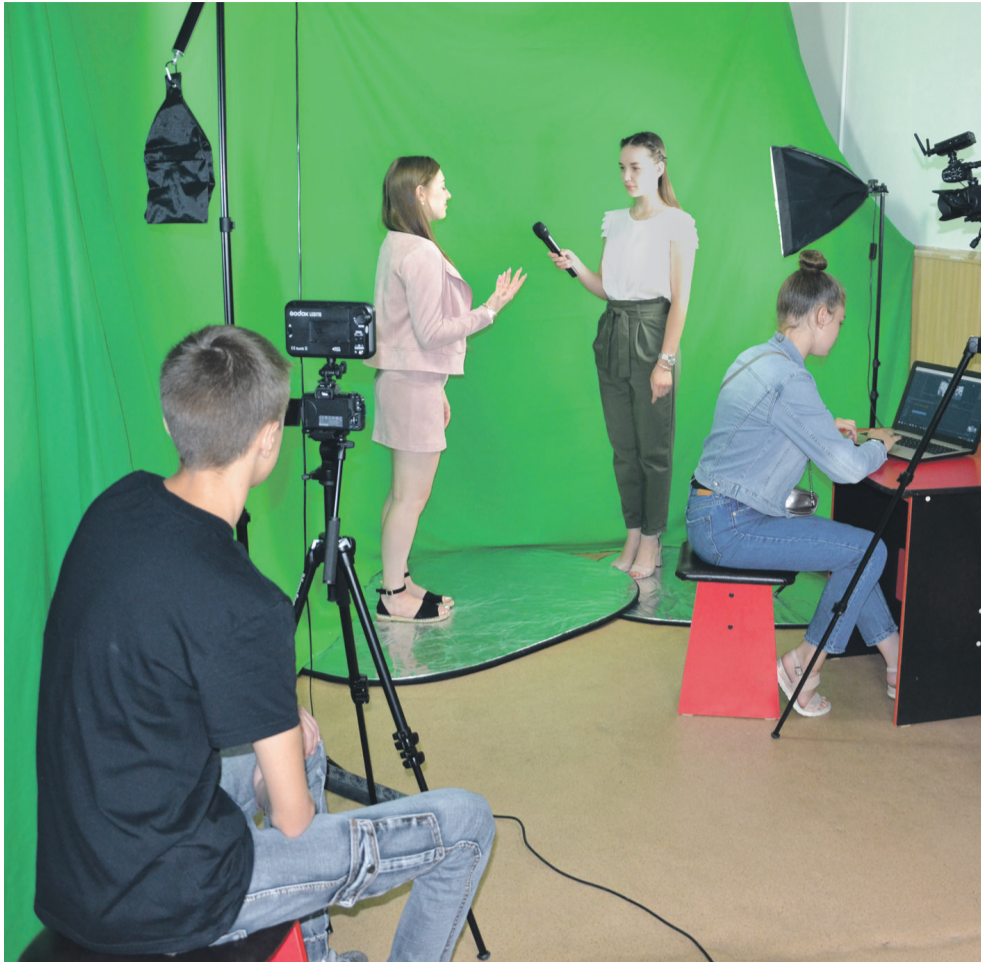
В школьном медиацентре «МедиаДикт» школы № 1