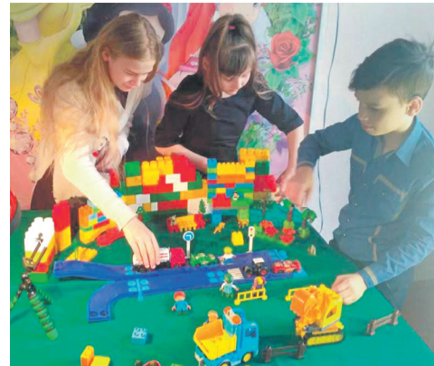
Студия мультипликации в Доме детского творчества