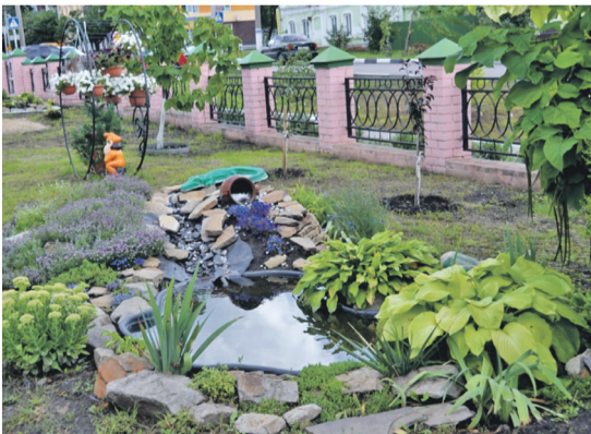
Ландшафтный дизайн на территории школы № 2