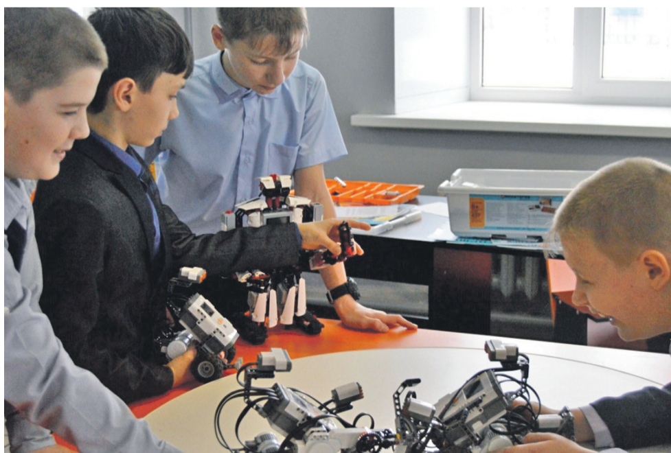
Технопарк в школе № 1

Ещё один важнейший элемент современной инфраструктуры — создание цифровой образовательной среды. Для решения проблемы взаимоотношений «цифровые ученики и нецифровые» учителя создали школьный медиаклуб «МедиаДикт».