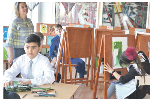
В изостудии школы № 4