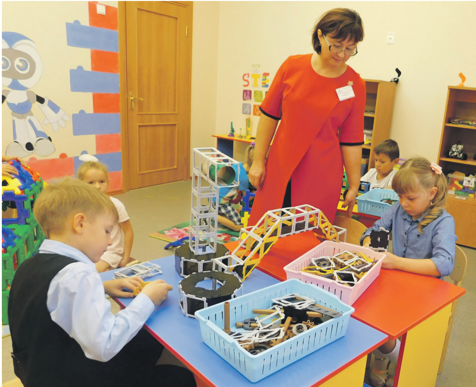
Инженерное образование малышей начинается с конструирования

Школьный технопарк позволяет создать эффективную систему профориентации, популяризировать среди школьников и их родителей востребованные инженерные и технические специальности. И, конечно, помогает выявить «техно-звёздочек» среди учеников в сетевом взаимодействии образовательных учреждений города.